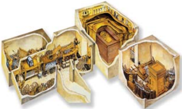
Skizze zum Grab

Howard Carter vermutete das Grab Tutanchamuns unter Ruinen antiker Bauhütten, die für das Grab Ramses VI. im Tal der Könige errichtet worden waren.