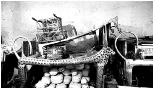
Blick auf die Ritualbetten in der Vorkammer

Howard Carter vermutete das Grab Tutanchamuns unter Ruinen antiker Bauhütten, die für das Grab Ramses VI. im Tal der Könige errichtet worden waren.