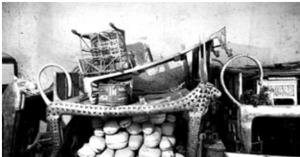
Blick auf die Ritualbetten in der Vorkammer

Das Schulmaterial ist auf die in der Ausstellung präsentierten Objekte abgestimmt. Alle Ausstellungsstücke sind exakte Kopien der Schätze des Grabes von Tutanchamun, an denen Kunsthandwerker in Ägypten in aufwändiger Handarbeit mehrere Jahre gearbeitet haben. So entstanden einzigartige Objekte, die es ermöglichen, die Fundsituation des Grabes, wie es Howard Carter im Jahr 1922 entdeckte, zu rekonstruieren. Anhand der Grabbeigaben können auch viele Aspekte des altägyptischen Lebens und der Herrschaft der Pharaonen auf besonders anschauliche Weise dargestellt werden.