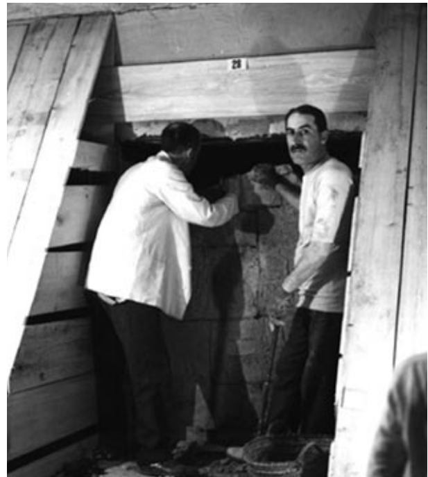
Howard Carter bei den Arbeiten an der Grabkammer