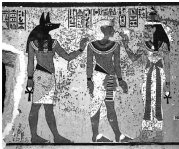
Fresko der südlichen Wand im Gang zwischen Vor- und Grabkammer. Tutanchamun, gefolgt vom Gott Anubis, erhält von der Göttin Hathor Leben.

Zu den letzten Pharaonen der 18. Dynastie zählen der Priesterkönig Eje und General Haremhab. Unter Haremhab und seinen Nachfolgern wurden viele der Denkmäler und Statuen der Amarna-Zeit zerstört, leider auch Zeugnisse von Tutanchamun. Alte Inschriften des Gottes Amun stellt man wieder her. Statuen Tutanchamuns sind von Haremhab verän-