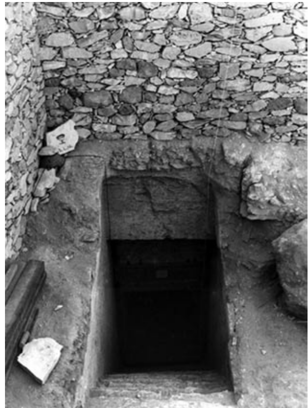
Treppe zum Grab von Tutanchamun

in ihm das Interesse für die Ägyptologie, und im Herbst 1907 erhielt er eine Grabungslizenz für Theben. Unterdessen entdeckte das Ausgrabungsteam von Theodore Davis im Tal der Könige einen Fayencebecher mit dem Namen von Tutanchamun als ersten Hinweis dafür, dass ein Grab dieses Pharaos im Tal der Könige existieren müsste. Schließlich fand Davis noch eine Grube mit Balsamierungsmaterial und Resten einer Totenfeier für Tutanchamun, dazu Fragmente von Goldfolie mit weiteren Namenskartuschen dieses Pharaos. Im Jahr 1915 übernahm Carnarvon die Grabungslizenz von Davis. Der Erste Weltkrieg brachte die Vorbereitungen für Ausgrabungen zum Erliegen und so begann erst im Herbst 1917 die systematische Suche des Ausgrabungsteams im Tal der Könige nach dem Grab Tutanchamuns. Carter hatte die Stellen, an denen bislang die Hinweise auf Tutanchamun gefunden worden war, auf einer Karte markiert und daraus eine dreieckige Fläche gebildet. Diese teilte er auf der Karte